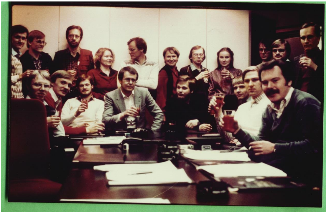
Kuva 3: Syconin laivaseminaari todennäköisesti vuonna 1983 2 .