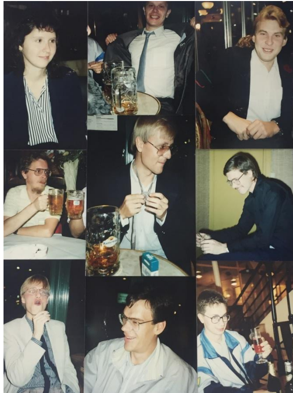
Kuva 4: Helsingin PC-Konsultit Pariisissa syksyllä 1988 3 .

PC-Konsultit Oy (myöhemmin Systation Oy). Emoyhtiö Sycon Oy keskittyi Honeywellin DPS6/DPS8-koneisiin ja sitä veti Matti Savolainen. Yhtiöryhmän neljäs yritys Sys-Vest Oy keskittyi IBM-suurkoneisiin ja siitä vastasi Esa Salminen.