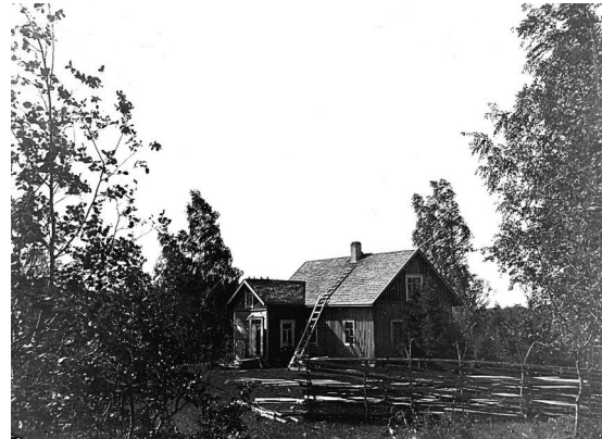
Kaartisten Särkkä-niminen talo Lumivaarassa.