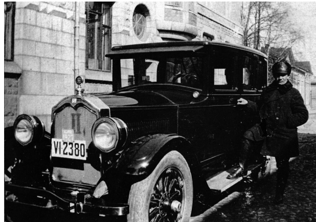
Isän autot olivat huippuluokkaa.