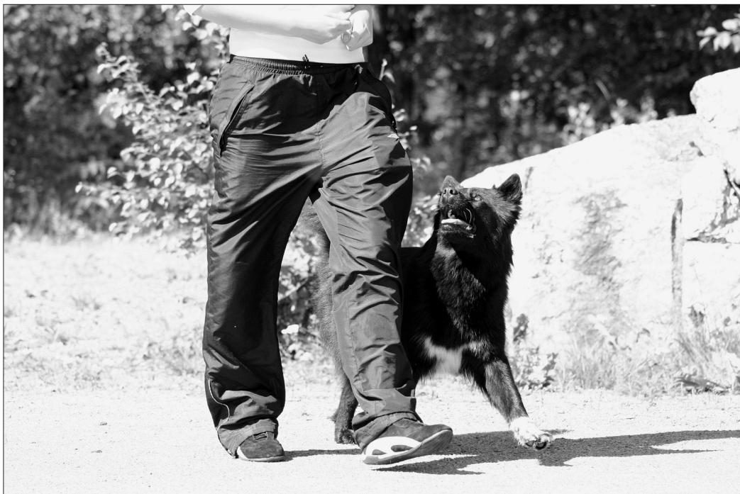
Suomenlapinkoira työskentelee hyvällä vireellä, innokkaasti ja halukkaasti.

On hyvin tavallinen virhe, että koira äänтелеe voittaja- ja erikoisvoittajaluokan seuraamisen askelsiirtymissä. Tätä ongelmaa on huomattavasti hankalampi