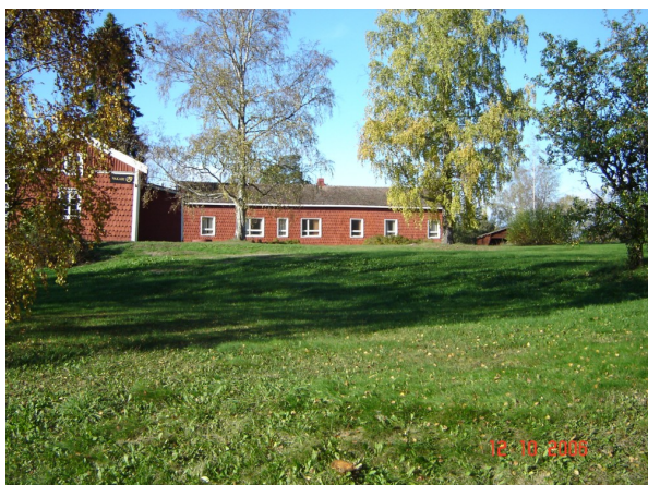
Polson talo (Maisansalo)