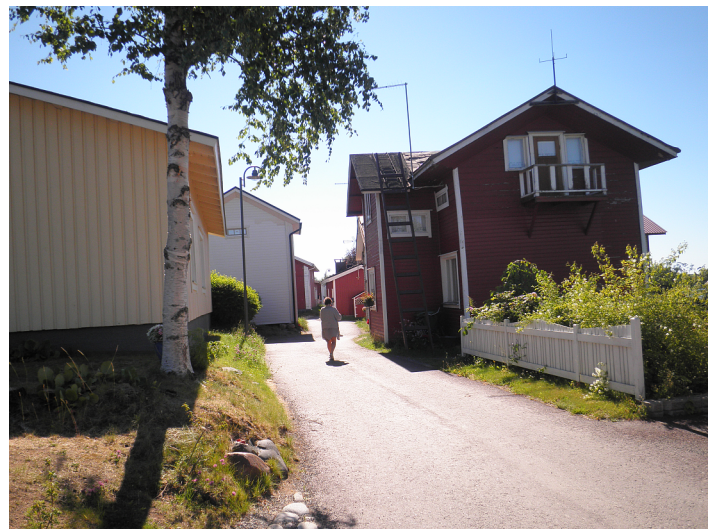
Iin Wanhassa Haminaassa

Saimme käsiimme reittioppaan, jossa ohjeistettiin: "Kun kuljet täällä Haminaassa, niin koitappa muistaa, että oot keskellä asuttavaa kylää. Nättejä taloja ja kukkapenkkejäki voit ihhailla ja jopa kuunnella joskus hilijaisuutta. ..Muista kuitenkin kunnioittaa asukkaijen kotirauhaa ja pysyvä kavuilla. Muuten kyllä ihmiset täällä ovat tottuneet turisteihin ja kaiken mailman töllistelijöihin, eivätkä utelijaat ylleensä kenenkään elämänmenua haittaa tai arkisija touhuja häiritte."