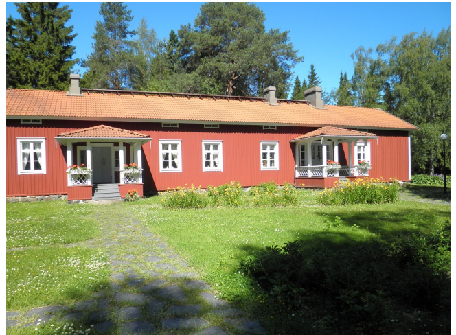
Mutalan kartano Raahessa. Se toimii nykyisin Rautaruukin edustustilana.

Tutkimusmatkallani isovanhempieni sukujen maailmaan olen siirtynyt isäni vanhempien kotiseuduille. Kun äidin vanhemmat veivät minut Sveitsiin, Latviaan, Venäjälle ja Ruotsiin, olen isäni vanhempien matkassa tutustunut kotimaahani. Hämeen maisemat tunsin toki ennestään, mutta pohjoinen Pohjanmaa ja li olivat minulle aivan uusi kokemus. Ajelin ystäväni kanssa ensin etelä-pohjanmaalle Nurmoon, jossa hänellä on kesäkoti. Sieltä lähdimme seuraavana aamuna nousemaan kohti Iitä. Ensin kävimme kääntymässä Raahessa, Mutalan kartanon pihalla, ja sieltä jatkoimme Oulun kautta Iihin ja Yli-Iihin, josta isäni äidin, isoäidin, suku on lähtöisin. Kun löysin isoäidin isoisän rakentaman Kauppilan