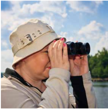
Hän bongaa lintuja.