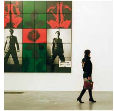
Hän käy taidenäyttelyssä.