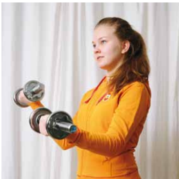
Hän käy kuntosalilla.