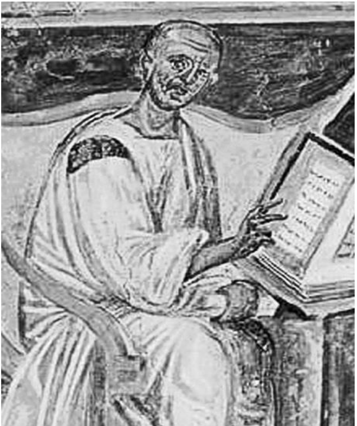
Aurelius Augustinus 354–430, kristinuskon aseman huomattavin vakauttaja aikanaan, hänen jälkivaikutuksensa arvioidaan kirkkoisista suurimmaksi. Varhaisin kuva Augustinuksesta on tämä 500-luvun alusta. Tuolloin löydettiin kirkkoisien tekstejä varustettuina heidän kuvallaan. Kuvan oletetaan tavoittavan näköisyyttä. Kuva on Rooman Lateraanikirkossa.