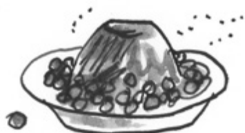
Siirappikakku ja herneitä.