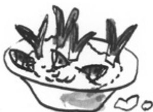
Sardiineja ja riisipuuroa.