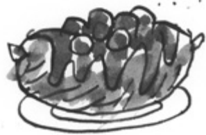
Ryynimakkaraa ja sen päällä säilykekirsikoita sokeriliemessä.