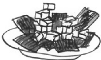
Suolalihaa ja ananaspaloja.