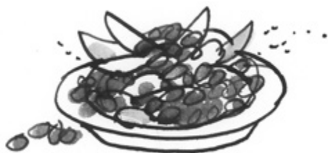
Pajuja tomaattikastikkeessa ja säilykepersikoita.