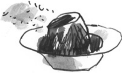
Tomaattikeitolla päällystettyä suklaakakkua.