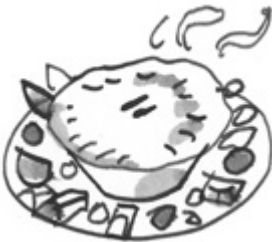
Munuaispiirasta ja säilykehedelmiä.