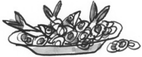
Sardiineja ja spagettirenkaita.