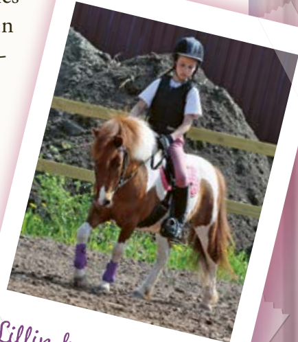
Lillin kanssa kisoissa