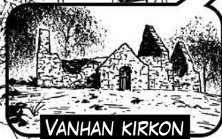
VANHAN KIRKON RAUNIOT