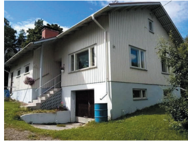
Omakotitalo vuonna 2023.

Asuimme Nokian Puolukkapolulla Mäkimaan talossa, talo oli niin sanottu paritalo. Meidän perheemme asui talon toisessa päässä ja isän veljet toisessa päässä. Isä ja äiti olivat hankkinut tontin Sammalpolulta. Sammalpolku on noin puolenkilometrin mittainen katu, joka päättyy toisesta päästä Aarnoin katuun ja toisesta päästä Puolukkapolkuun, jossa on t-risteys, ja risteyksestä johti pieni mäki alaspäin. T-risteyksen vieressä oli iso kivi, jota kutsuimme sokerikiveksi, lähialueen kylän kakarat leikkivät niin sanotun sokerikiven ympärillä. Tontti oli erittäin kallioinen ja kivinen, monet ihmiset ihmettelivät,