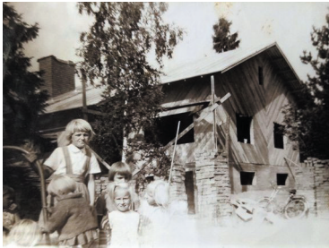
Talon rakennusta 60-luvulla.

Isä palasi ruotsista 1954 ja palautti Railin itsellensä, ja siinä samassa tuli myös Pauli äidin ja Isän perheeseen.