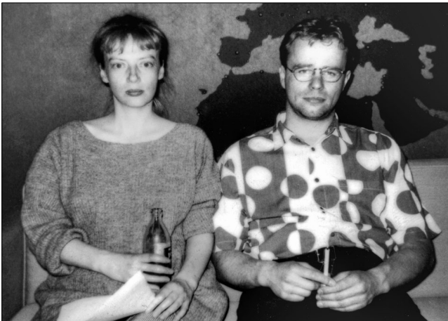
A-Studioossa v. 1994, kuvaaja tuntematon

mutta he tekivät kaikesta muusta juttua kuin jäsenäänestykseen vaikuttavista asioista. Ajankoh- taisohjelmissa toistettiin taloustoimittajien taika- loitsua: työvoiman vapaa liikkuvuus, ruokakorin hinta halpenee, työvoiman vapaa liikkuvuus, ruokakorin hinta halpenee. Äänestin EU:hun liitty- mistä vastaan, samoin ajatteli 43 % kansasta. Vähitellen minulle valkeni mihin osallistuin. Olin mukana ajankohtaistoimituksen aivopesussa. Yleisradiossa mieliä muokattiin hienovaraisesti kiinnittämällä huomio vain tiettyihin kielteisiin tai myönteisiin asioihin. Katsojat eivät epäilleet suosittuja uutisankkureita ja luotettavan tuntuisia toimittajia, jotka tuntuivat olevan kansalaisten puolella ja uskoivat niin itsekin.