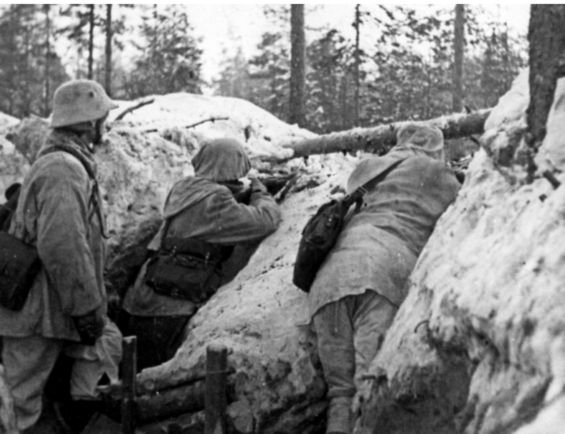
Suomalaisia torjumassa venäläisten hyökkäystä helmikuussa 1940

– Se oli tavoite, johon panostettiin tosissaan. Venäläiset kävivät puolestaan Summassa kilpajuoksua aikaa vastaan. Pääpuolustuslinja oli pakko saada murrettua, koska edessä hämötti riski länsivaltain väliintulosta, Jalonen kertoo.