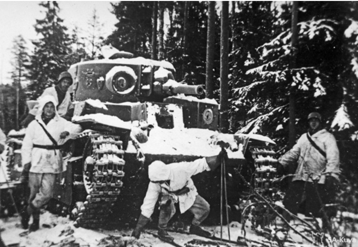
Suomalaisten valtaama venäläisten hyökkäysvaunu Summassa 1939.

– Tällöin ne altistuivat suomalaisten lähitorjunnalle. Suomalaisilla oli pääpuolustuslinjalla muutamia ruotsalaisvalmisteisia Boforsin panssarintorjuntatykkejä, mutta huomattava osa vihollis-